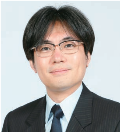
岡山県保健医療部 保健医療部長